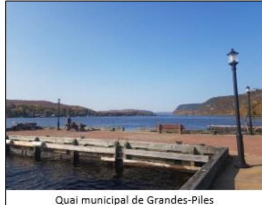
Quai municipal de Grandes-Piles